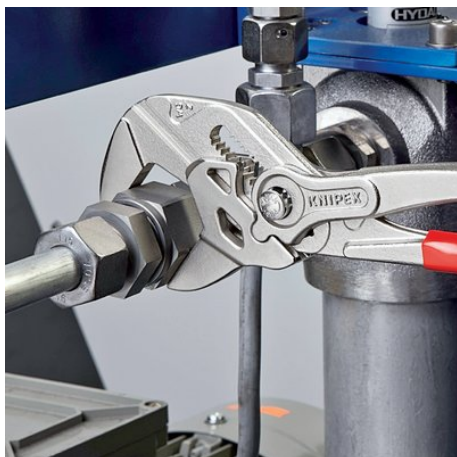
Zastępuje wieloczęściowy zestaw kluczy metrycznych i calowych